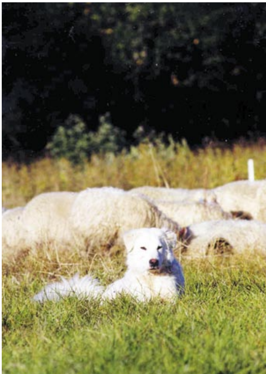
Hunden kommer i takt med mognad att bli mer aktiv i sin roll som boskapsvaktande hund. Vissa beteenden ökar i frekvens, t ex patrullering och doftmarkeringar. Mastino Abruzzese.