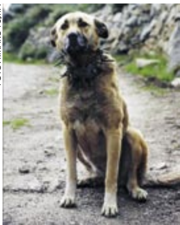
Cão da Serra da Estrela

Det finns en rad olika boskapsvaktande hundraser i världen, t ex har många länder i Europa egna inhemska raser. Bilderna visar bara några exempel på raser. Det finns även variationer i utseende inom raserna.