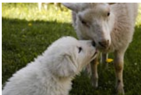
Maremano Abruzzese valp, Värmland.

Hundar som arbetar på olika sätt kan komplettera varandra. En av hundarna kan till exempel vara mer benägen att patrullera av området medan den andra är mer benägen att stanna vid fårflocken och reagera aggressivt enbart när något närmar sig flocken.